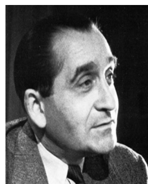
פייר מנדס פרנס

על האנייה הזו היו שני אישים מפורסמים, ג'ורג' מנדל, יהודי שהיה שר הפנים, ופייר מנדס פרנס, שהיה חבר פרלמנט. כשהגיעו לרבאט שבמרוקו, הם נעצרו ע"י המשטרה הצרפתית, בהוראת הנשיא הנבחר של צרפת של וישי, שהתנגד למהלכם. הם נכלאו ונשלחו חזרה לצרפת. את ג'ורג' מנדל, שלטונות וישי רצחו בכלא ופייר מנדס פרנס הצליח לברוח, להתנדב לצבא צרפת החופשית, להלחם כטייס קרבי, עם גיחות רבות, במשך רוב מלחמת העולם השנייה, זכה לאותות הצטיינות רבים, לימים היה ראש ממשלת צרפת.