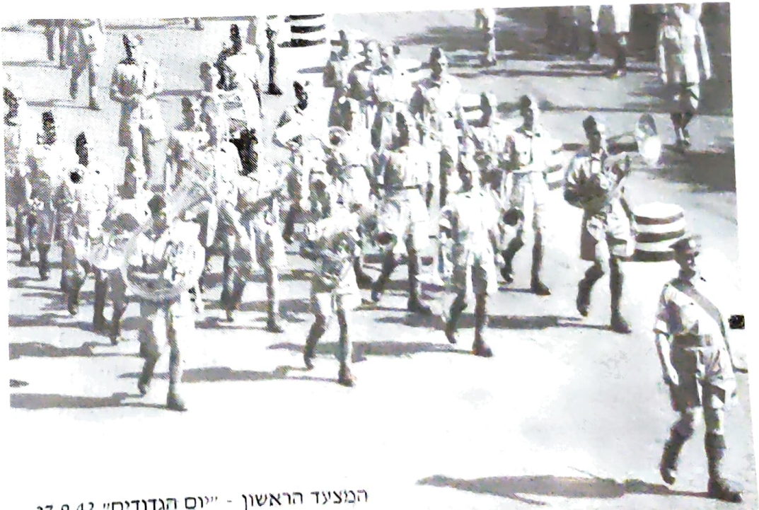
הבוציעד הראשון - "יום הגדודים" 27.9.42

מפת ההופעות שלנו כיסתה את כל ארץ-ישראל המערבית. בהיותנו התזמורת הצבאית היחידה בארץ, לא היה אירוע צבאי שלא נטלנו בו חלק: טקסי סיום קורסים, סיומי טירונות, ימי ספורט יחידתיים, תחרויות איגרוף, כדורגל והוקי, מסדרים חגיגיים (מלבד המסדרים בסרפנד שנערכו כל שבת לפני הצהרים), קונצרטים ביחידות השונות של כוחות בעלות הברית שחנו בארץ, בעיקר ביחידות העבריות - וכמובן מצעדים בחוצות ירושלים, תל-אביב וחיפה שמטרתם היתה להגביר את הגיוס לפלוגות ה"באפס" שמהן הורכבה מאוחר יותר הבריגדה היהודית.