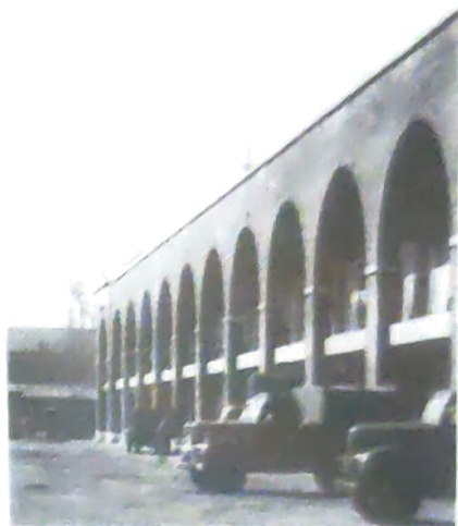
הקסרקטין בדנדרמונדה - 1945

היטלר. את חגה הלאומי של צרפת, ב־14 ביולי חגגנו בעיר קלה בקונצרט באולם המרכזי של העיר בניצוחו של מוני ריקליס.