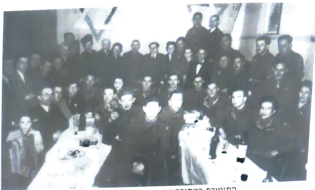
התזמורת במסיבה עם הקהילה היהודית בבריסל