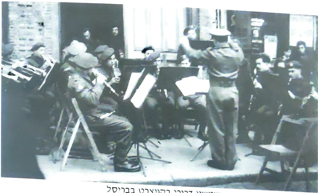
שמשון דרורי בקונצרט בבריסל