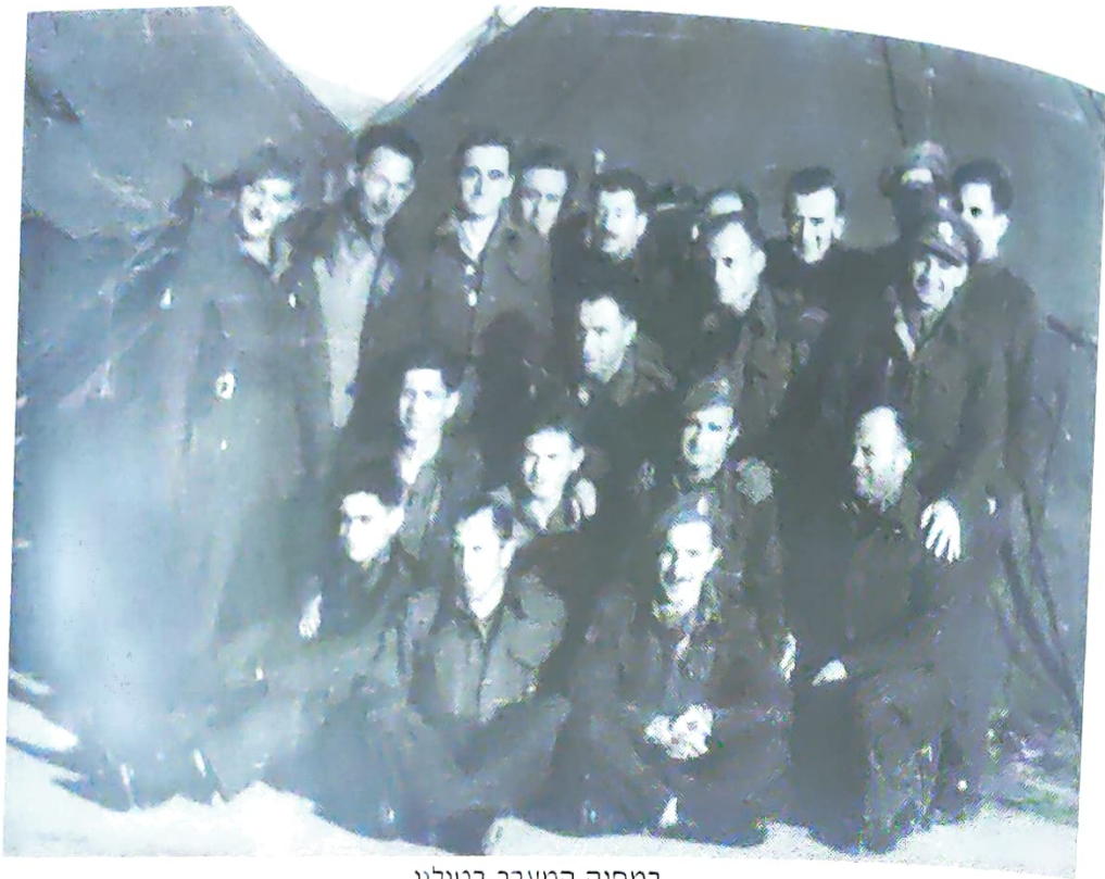
במחנה המעבר בטולון

לרגלינו. גם כאן לא חיכו לנו כל הוראות להמשך הדרך והועברנו למחנה מעבר בקרבת העיירה הייר. ניצלנו את הזמן לטיולים בסביבה ההררית והתפעלנו מהמדרונות העטויים כרמי יין.