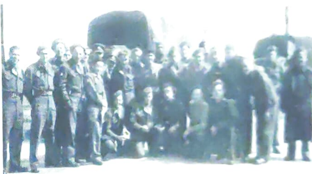
התזמורת על גלגלים - מהופעה להופעה

חשנו גאוה על ההופעות בפני אחינו ניצולי השואה, שהבאנו להם מזמרת הארץ. השתדלנו במידת האפשר להופיע בקהילות היהודיות שהחלו להתארגן מחדש.