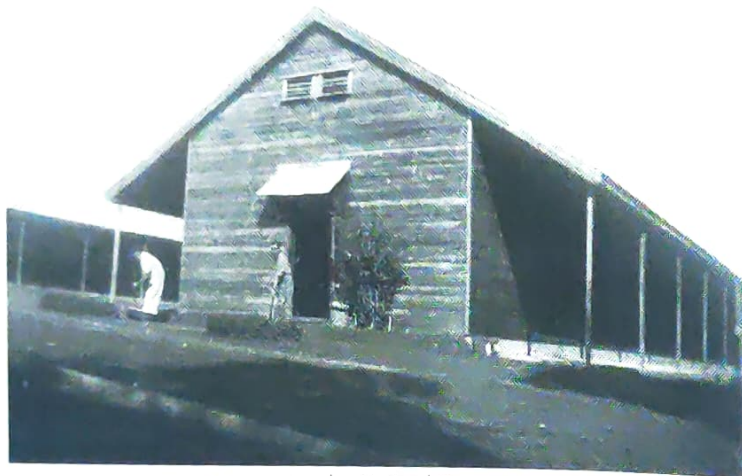
ניקיון יסודי של הצריף לקראת הביקורת

הראשון שבו "בילינו" בצריף החדש, היינו כולנו עקוצים בכל חלקי גופנו עד זוב דם. פתחנו מיד במלחמה נגדם. ובמלחמה - כמו במלחמה. השתמשנו בליטרים של ליזול ונפט, במברשות ואף באש. בנרות ובלפידים מאולתרים שרפנו כל פינה וסדק ברצפה, בקירות ובתקרה.