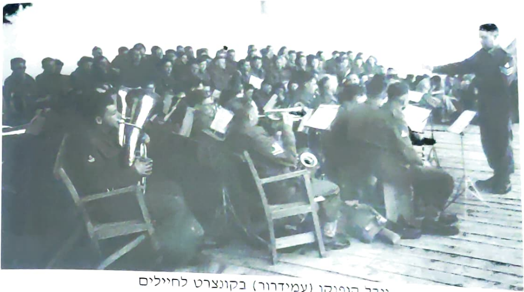
יובל הופנקו (עמידרור) בקונצרט לחיילים