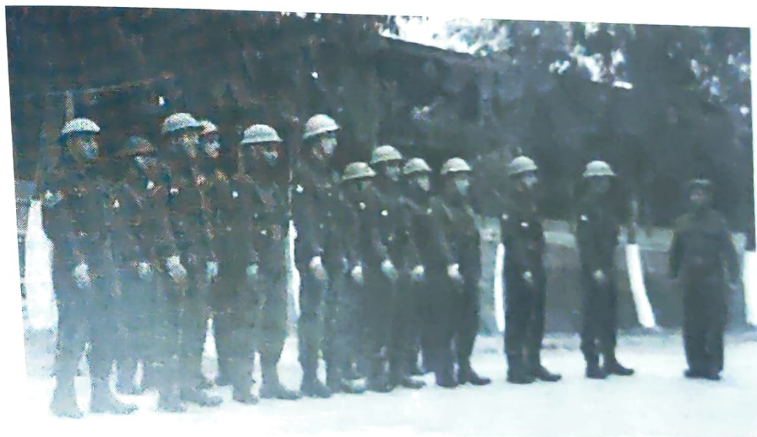
מסדר "עליות משמר" של התזמורת

בנוסף, השתתפנו מדי פעם בשמירה היקפית על הבסיס. במקרים כאלה היינו מתייצבים על נשקנו המכודן חבושים בקסדת פלדה ברחבת המסדרים, ולאחר הביקורת צועדים בשלשות ובשמאל-ימין לעבר חדר המשמר, ה-Guard Room.