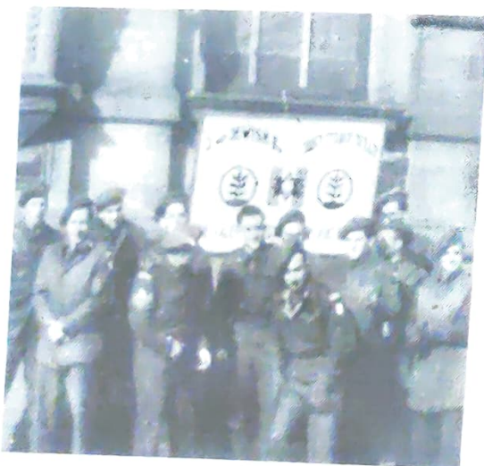
מפקדת הגדוד השני באנטוורפן

ב-1.3.46, התפרסמה בעיתון "החיל", עיתון יומי לחיילים עבריים ההודעה הבאה: