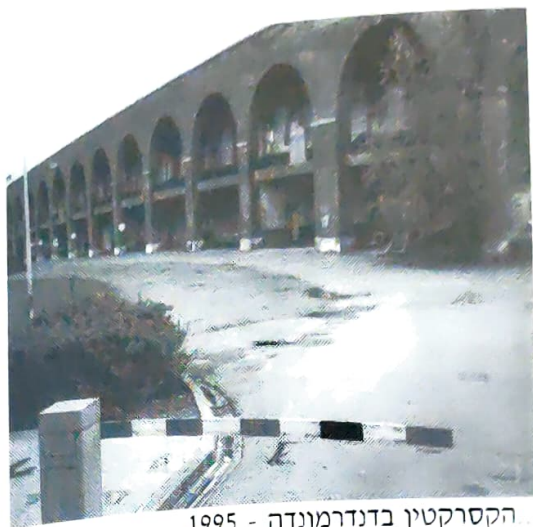
הקסרקטין בדנדרמונדה - 1995