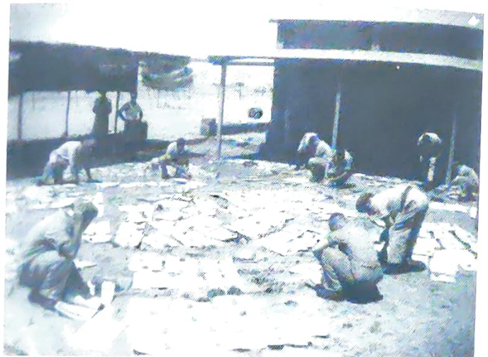
ייבוש תווים בשמש החמה

ואוהלי המגורים הוצפו ונאלצנו להוציא את המים באתים ובדליים ואת התווים שנרטבו - שטחנו בחוץ לייבוש, על מנת שנוכל להמשיך במשימותינו.