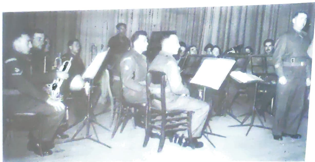
התזמורת בהופעה בפני תלמידי בתי הספר היהודיים בבריסל