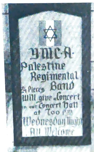
אולם הצעירים הנוצרים שעבר "גיור"

ימי שהותנו בקרב הבריגדה, שהיו לצערנו קצרים מדי, היו לנו הימים המאושרים ביותר בכל שנות שירותנו בתזמורת. תוכניות הקונצרטים כללו בעיקר