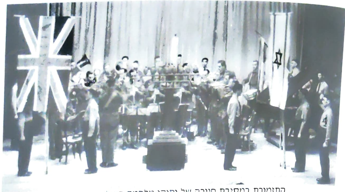
התזמורת במסיבת חנוכה של ותיקי מלחמת העולם הראשונה