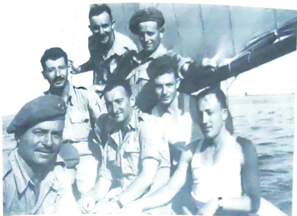
"סוסיהאים על פני המים" - מול איסמעיליה

שעננה באגם מול איסמעיליה, להתפעל מהפירמידות והספינקס בקאהיר, להידחק בתוך טראמים צפופים ו"מריחים" וליהנות מגלידה קרה ומעוגה טעימה בקפה "ג'רובי" הנודע. לחלק גדול מאתנו ה"צברים" היתה זו יציאה ראשונה לחוץ לארץ וטעם היציאה הזאת נשאר בפינו לזמן רב.