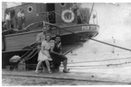
הורי בנמל לה-ספציה, אפריל 1946