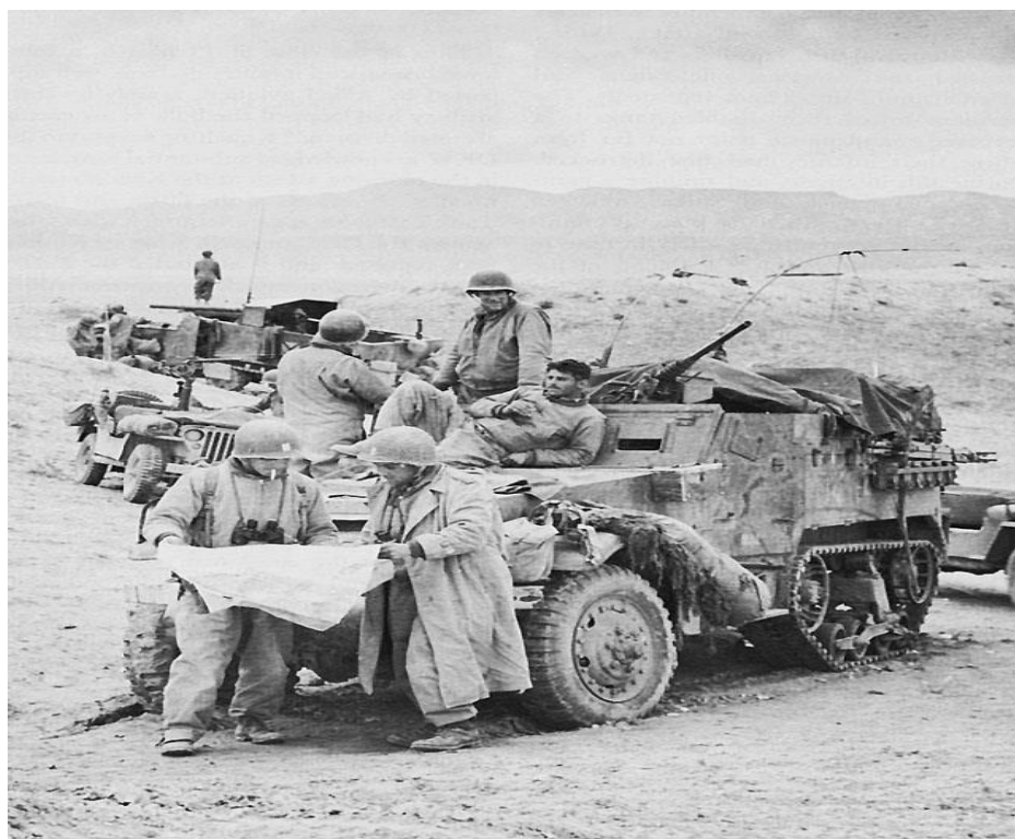
חיילי גד' משחית-טנקים 601 במערכה בצפון-אפריקה.

ובעקבותיו משחית-הטנקים לאחר שהשליכו כמה נרות עשן ובמסתור העשן החלו בתנועה לאחור אשר מהר מאד גרמה להתפוררות הארגון לקרב כשכל מט"ן דואג לעצמו. 6 לורנס מרכוס, אשר מחלקתו נותקה משאר הפלוגה, המשיך לפקד עליה ולבקר את האש תוך פעולה בשני צמדים של מט"נים. בינתיים, התמקם לורנס בעמדת תצפית קרקעית על גבעה קטנה ממנה יכול היה לראות את האגף הגרמני ולהמשיך בבקרת האש. כאשר החלו משחית-הטנקים לסגת אבד לו הקשר אתם והוא נשאר בודד, רגלי, בשטח בין הגרמנים לאמריקאים הנסוגים. מחששו מנפילה בשבי קרע מפנקסו דפים עליהם רשם רשימות שנראו לו מסווגות, לעס אותם ובלע אותם. הגרמנים המשיכו להתקדם ואף מיקמו עמדת מרגמה בקרבת הגומה אותה חפר בקרקע על מנת להסתתר. לורנס החליט לנסות ולחבור רגלית ליחידתו. הוא קם והחל ללכת לאטו כאילו הוא אחד החיילים הגרמנים בלא למשוך תשומת לב. כך הצליח לורנס להסתנן דרך מערכי הגרמנים וכעבור יומיים מצא שוב את יחידתו שהתארגנה מחדש וכבר הכריזה עליו כנעדר. 7 היה זה ממערב לסביטלה אשר צוות-קרב B לא הצליח להגן עליה ונסוג ממנה יחד עם המט"נים של גד' 601.