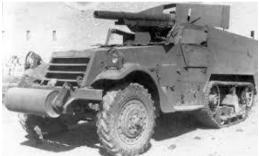
משחית-הטנקים M-3 75 מ"מ.

הפתרון שאומץ היה לפתח משחית טנקים ייעודי שיוכל להתמודד עם הטנקים הגרמניים, ואכן הוחל בפיתוח כזה שלבסוף יוצר בדמות ה-M-10 אבל בינתיים המלחמה לא יכלה להמתין לפיתוח האמל"ח החדש. פתרון הביניים עבור הנ"ט היה מאולתר, הקמת גדודי "משחית-טנקים" (Tank Destroyers) אשר עליהם הראשונים יהיו תותחי-שדה 75 מ"מ מתנייעים על זחל"מים, משחית-טנקים ראשוני, מאולתר זה כונה: 75 mm Gun Motor Carriages M-3 5 . היה לו צוות של 5 ו-59 פגזים, נפיצים וחודרי-שריון.