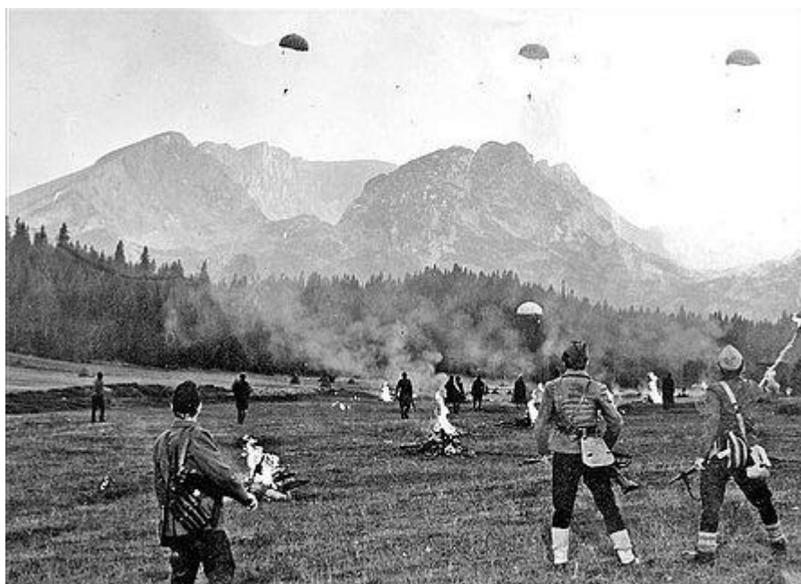
הצנחה בריטית לפרטיזנים במהלך המערכה

קפטין ביל דיקין וקפטין ויליאם סטיוארט. 5 בין ארבעת הבד"א האחרים היה האלחוטן של המשלחת, הצנחן הארץ-ישראלי פרץ רוזנברג. המשלחת נועדה להוות גוף קישור בין מפקדת הפרטיזנים לפיקוד המזרח-התיכון, לאסוף מודיעין על המתרחש ביוגוסלביה ולחבל במערכת התחבורה הגרמנית בבלקנים בדרכה לזירת הים התיכון. קפטין דיקין מונה כקצין הקישור בין טיטו לגנרל הרולד אלכסנדר, מפקד כוחות בעלות הברית במזרח התיכון, וקפטין סטיוארט היה אמור לרכז את מבצעי החבלה בעורף הגרמני.