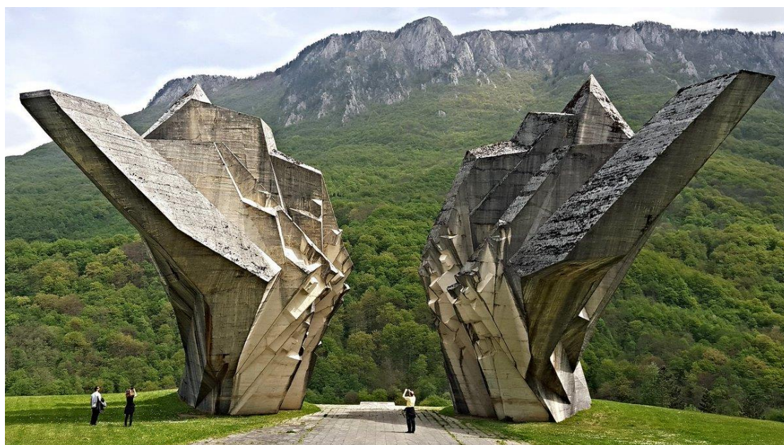
אנדרטת ההנצחה של מערכת סוטז'סקה בעמק הגיבורים ליד טיינטישטה, בבוסניה-הרצגובינה.

כוחו של טיטו לאחד מבעלי הברית בלחימה העולמית נגד הנאצים. וההספקה והסיוע שהחל להתקבל מפיקוד המזרח התיכון לפרטיזנים של טיטו. כעבור פחות מחודשיים, בראשית חודש ספטמבר 1943 עברה איטליה להיות אחת מבעלות הברית והצבא האיטלקי בבלקנים הפך אויב של הגרמנים ובמקרים רבים עבר לסייע לפרטיזנים. 10 מהפך זה הוציא את השותף העיקרי של הגרמנים מהמלחמה נגד הפרטיזנים וקיבע את המערכה על הנהר סוטז'סקה או כפי שנקראה ע"י הפרטיזנים בעת ההיא "המתקפה החמישית", כמתקפה רחבת היקף האחרונה של הגרמנים כנגד הפרטיזנים, הקשה והמורכבת ביותר ואשר נכנסה לפנתיאון של האומה היוגוסלבית כמערכה המעצבת בתולדותיה, ובתוך כך התמונה של חטיבה 6 הבוסנית של גוראנין הפורצת את הכיתור תוך צליחת הנהר בנושאה 600 פצועים נחרטה בהיסטוריה. המערכה הונצחה בסרט הוליבודי בכיכובו של ריצ'רד ברטון, על המטבע היוגוסלאבי בן 10 דינר ובפסל ענק ב"עמק הגיבורים".