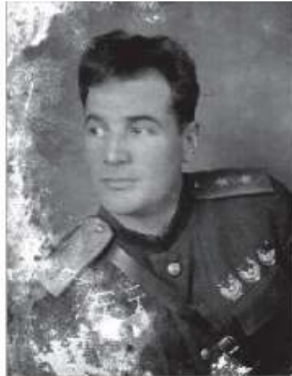
Иван Данилович ЧЕРНЯХОВСКИЙ 1906 (1907) — 1945