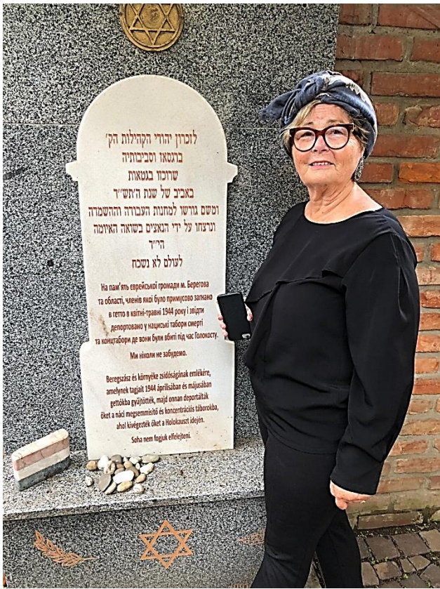
הנצחה לקהילות יהודי ברגסס והסביבה