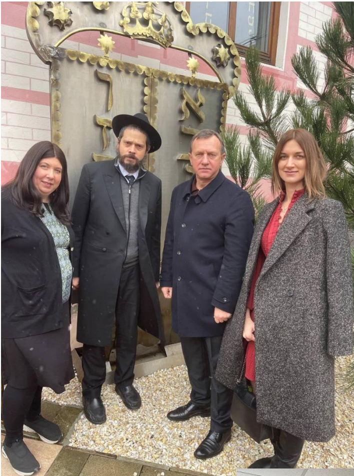
הרב ורעייתו עם ראש עיריית אוז'גורוד ועם ראש מינהל התרבות, הנוער והספורט של מועצת העיר

ב-18 בדצמבר בשעה 17:30, ליד הפילהרמונית האזורית באוז'גורוד, יודלק נר חנוכה ראשון. כל המקומיים מוזמנים לאירוע.