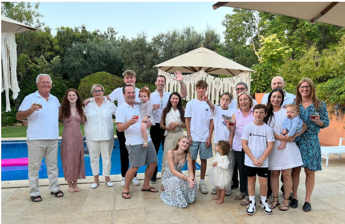
תמונה משפחתית – 3 דורות של משפחת פולג