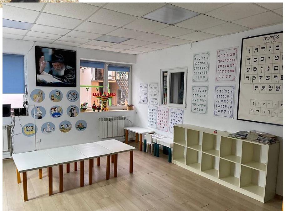
גן הילדים במרכז חב"ד באוז'גורוד