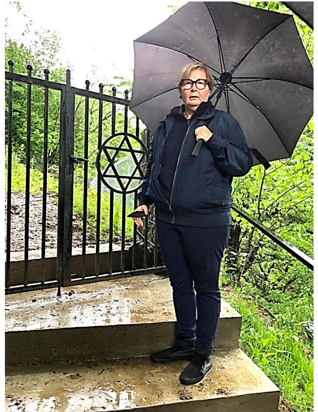
2019: בכניסה לבית העלמין בבוגדן