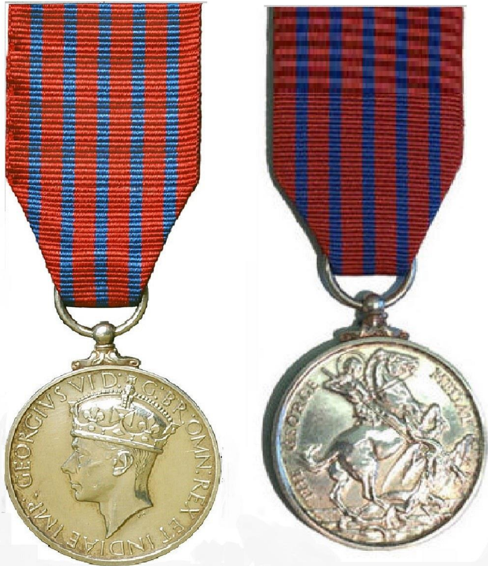
George Medal (WW2)

בארץ היא התגוררה בקיסריה אבל אשה כמוה לא יכלה לשבת בבית בחוסר מעש והחלה מטפלת בתושבים משכונות מצוקה, יהודים מאור עקיבא וערבים מבקה אל-גרביה. ד"ר חנה ביליג נפטרה בשנת 1987 ונקברה בבית העלמין בחדרה.