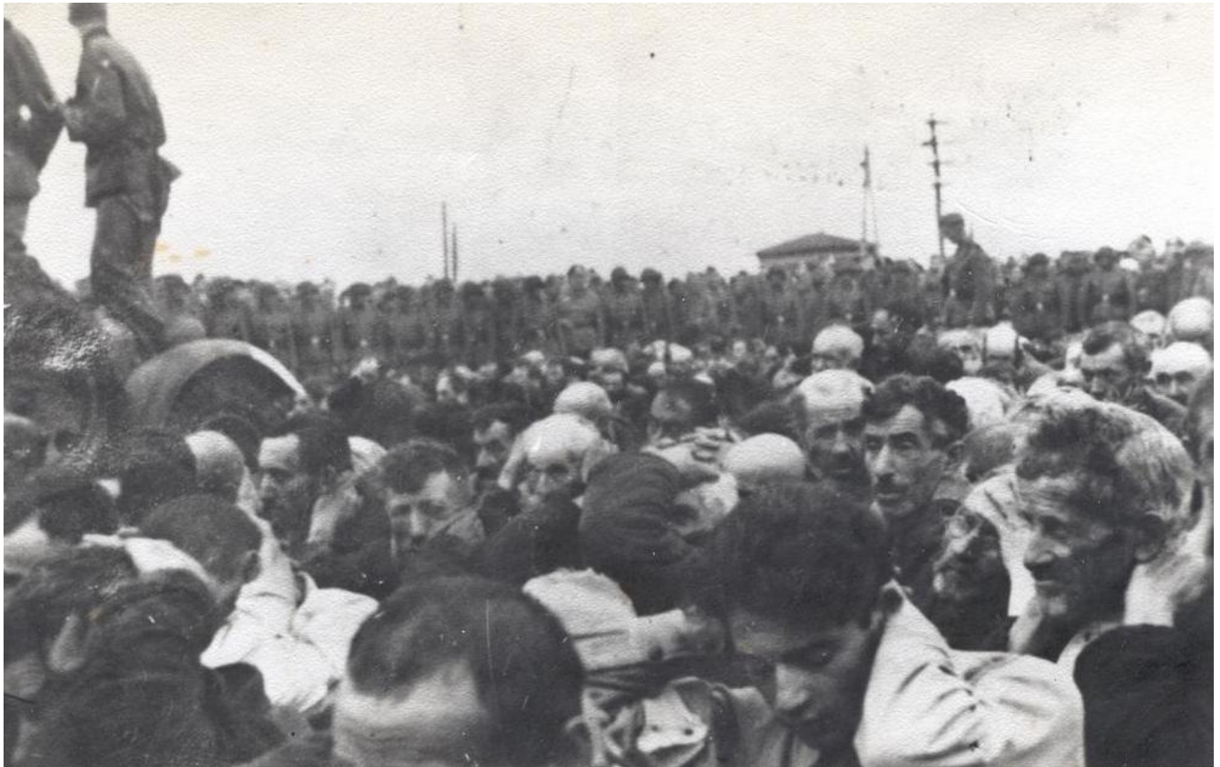
Ghetto Bialystok: Deportation, Source: private collection Ewa Kracowska

בשעה שש בבוקר נתלו מודעות על פינוי הגיטו ללובלין Lublin. על כל התושבים היה להתייצב ברחוב יורוויצקה Jurowiecka, משם יעבירו אותם הלאה. הגרמנים שהתנסו בגיטו ווארשה רצו למשוך את התושבים מהבלוקים הגדולים (ברחובות פולנה Polna, צ'נסטוכובסקה Częstochowska, נובי שוויאט Nowy Świat, קופייצקה Kupiecka) שמשם היה קל יותר להתנגד - אל הרחוב, ששם הבתים הקטנים והמגרשים הגדולים אפשרו לגרמנים חופש פעולה יותר גדול. נכשלו ניסיונות הלוחמים לעצור את זרם ההמונים ברחוב יורוויצקה, ההמונים שמילאו את הרחובות היו המומים ומיואשים. ריכוז, איפוא, את כל קבוצות הלוחמים מהאזורים שנעזבו על ידי התושבים באזור יורוויצקה, בעיקר ברחובות צ'פלה Ciepła, כמיילנה Chmielna, סמולנה Śmolna, נובוגרוצקה Nowogródzka וגורנה Górna. תכנית המטה היתה להרוס את גדרות הגיטו, כדי שההמונים יוכלו להתפזר בשטח ואילו הלוחמים הצטרפו לחדור ליערות ושם להצטרף אל חבריהם הפרטיזנים. אל הלוחמים, שלא הסוו יותר את נוכחותם בין ההמונים, הצטרפו עשרות אנשים נחוישים בדעתם ומזוינים במקלות, מוטות ואבנים.