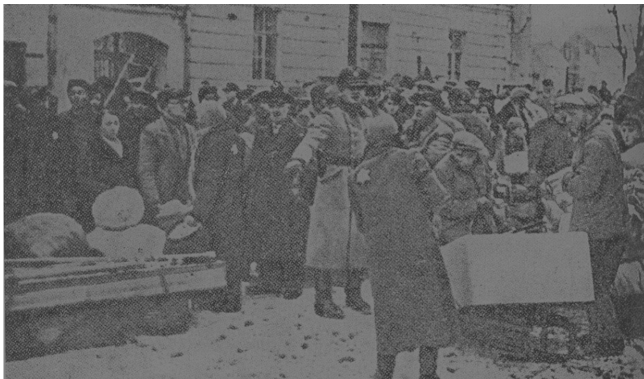
ביקורת בכניסה לגטו

הגרמנים הטילו על היהודים דמי-כופר בזהב (5 ק"ג), בכסף (20 ק"ג) ובמטבע סובייטית, וכדי לבזותם חויבו היהודים לשים טלאי צהוב על בגדיהם. ב-1 באוגוסט 1941 סגרו אותם בגיטו.