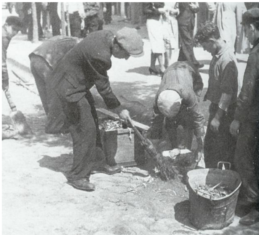
עבודות כפיה בגטו

העזרה של הנוער מהגיטו התבטאה לא רק בסעד חומרי. לשבויים סופק מידע על המצב בחזיתות לפי דיווחי רדיו מוסקבה ולונדון ונוצר הקשר עם העולם החיצון. נוצר הקשר עם הפרטיזנים, שאפשרו לרבים מהם לברוח. הפועלים היהודים המועסקים במחנה מטעם "Heeresbaumt" [1] יצרו מגע עם הכלואים בתיווכו של השבוי מהנדס איוואנין ורופא המחנה. העברת המידע והמתנות נעשו מרתפי בית-החולים של משרד הבניה הנ"ל. הדבר נעשה בסודיות מירבית, כי כל מי שנתפס במגע עם השבויים היה צפוי למוות. צריך היה להישמר לא רק מהגרמנים אלא גם ממלשינים ומאנשי וולאסוב [2] Włosoŵ וגם מיהודים שהיו חרדים לעורם הם. עזרה דומה אורגנה בנקודות שונות של העיר בהם עבדו שבויים ויהודים. המגע עם השבויים בשטח הקסרקטין של גדוד הפרשים העשירי נמשך עד מחצית 1942 ז.א. גם אחרי סיום עבודות משרד הבניה שם. בצורה זאת הביע הגיטו את נכונותו להיאבק וכן את אהדתו לאלה שהיו סמל חי של התביעה לזכויות האדם והיו מאוחדים בתקווה לניצחון על החיה ההיטלריסטית.