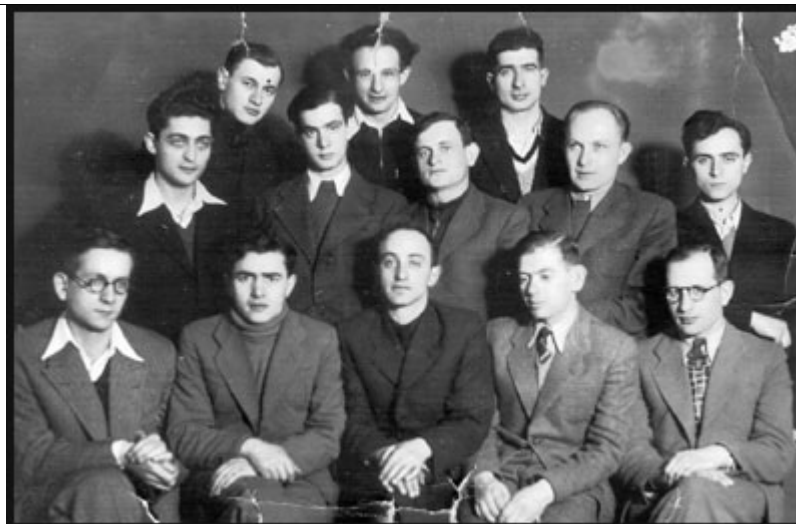
מחברי מחתרת גיטו ביאליסטוק ביאליסטוק