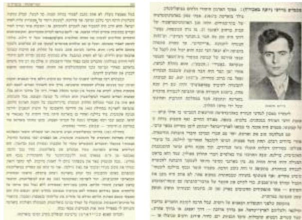
The biography of Mordechai Tenenbaum (Tamarof) source: Meilech Neustadt: Destruction and Rising, the Epic of the Jews in Warsaw, Tel Aviv 1946, page 302-303