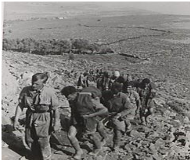
טור של אלפי שבויים בריטיים בכרתים ובכללם כ-200 חיילים ארצישראליים: 1 ביוני 1941

7 חיילים שאותרו במחקר הם נעדרים ושבויים שלא אותרו כפדויי שבי, ונדרש בירור נוסף אודות גורלם. מאלו 6 הינם חללים, שבויים ונעדרים אשר השתתפו בקרבות ביוון ובכרתים, אולם לא אותרו מסיבות שונות. 5 מהם נפלו בוודאות בשבי, אולם במסגרת מחקר זה לא אותר מידע על כי שוחררו מהשבי. מספר הנעדרים מהקרבות ביוון ובכרתים ברשימות המחקר, שגורלם לא נודע, עומד על חייל אחד בלבד. 25