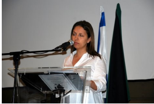
גילה גמליאל :

אני מזמין את סגנית השר בלשכת ראש הממשלה, לנושא צעירים, סטודנטים ומעמד האישה - חברת הכנסת גילה גמליאל לשאת דברים.