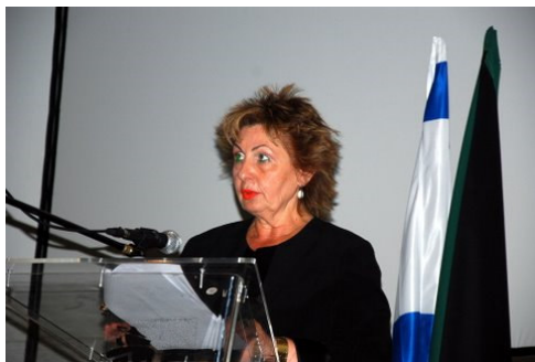
סופה לנדבר - שרת הקליטה:

ולדרך הזאת, אשר ממשיכה, נהיה שותפים כולנו. ולדרך הזאת, נושיט יד, כי זוהי הדרך שלנו.