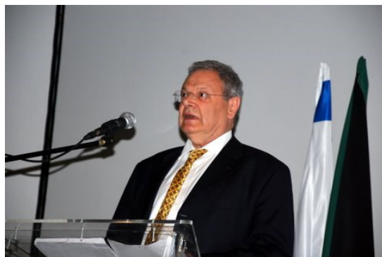
סר מרטין גילברט:

והיום, כאן במדינת ישראל, אני רוצה להגיד תודה על זה שהצלחנו, תודה על מה שעשיתם, תודה בשם מדינת ישראל.