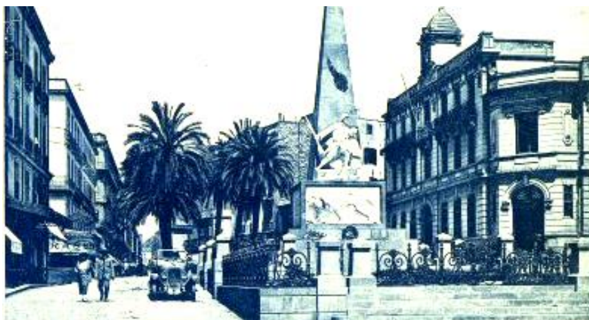
22 BÔNE - Le Monument aux Morts et la Poste

Le monument aux Morts de Bône avant juillet 1962 9 .