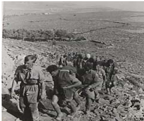
טור של אלפי שבויים בריטיים בכרתים ובכללם כ-200 חיילים ארצישראליים: 1 ביוני 1941

7 חיילים שאותרו במחקר הם נעדרים ושבויים שלא אותרו כפדויי שבי, ונדרש בירור נוסף אודות גורלם. מאלו 6 הינם חללים, שבויים ונעדרים אשר השתתפו בקרבות ביוון ובכרתים, אולם לא אותרו מסיבות שונות. 5 מהם נפלו בוודאות בשבי, אולם במסגרת מחקר זה לא אותר מידע על כי שוחררו מהשבי. מספר הנעדרים מהקרבות ביוון ובכרתים ברשימות המחקר, שגורלם לא נודע, עומד על חייל אחד בלבד. 25