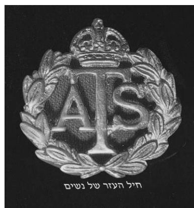
סמל יחידת הנשים – A.T.S.

בעלונים, שהיו מצרך מאד מבוקש בקרב המתגייסים, מופיעים מדי פעם מכתבים קצרים ודרישות שלום מהחיילים ומהם מתקבל מידע מועט, בעיקר עקב הצנזורה