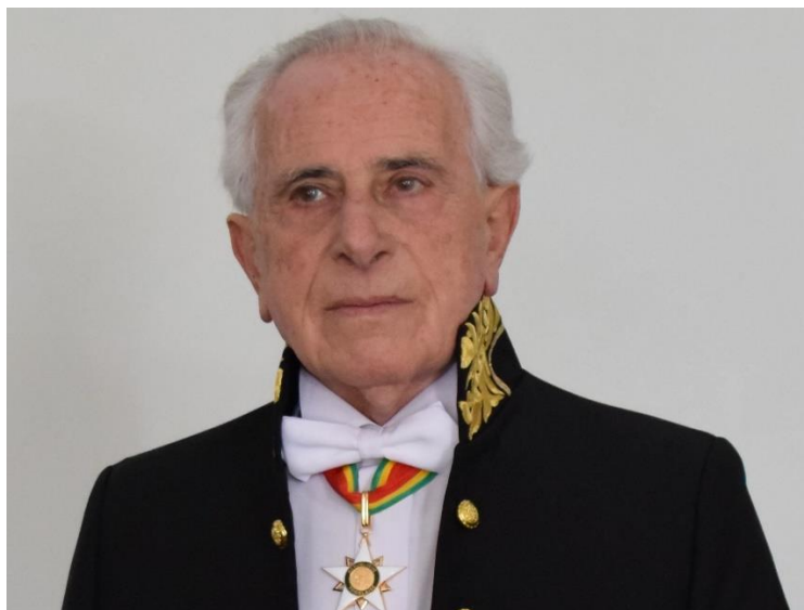
פרופ' ז'אן ז'ק אשכנזי

והודיעו לד"ר אשכנזי שהוא מקרה מאד קשה ומתבקש לאשר כי מכר את דירתו, על כל תכולתה, ב- 140,000 ליי מבלי שקיבל בפועל אפילו סנטים אחד. לאחר שאולץ לחתום על שטר המכר התבקש לשלם מס מכירה של עוד 30,000 ליי – באם לא ישלם תוך חצי שעה - עלייתו תבוטל. אולם הקולונל רצה גם כסף מזומן בדולרים ודרש לקבל $10,000. אשכנזי פנה לאמו אשר הגיעה יחד עם אחותה כאשר כל אחת מחביאה $5,000 בתחתונים. רק לאחר ששולמו כל הסכומים הנ"ל וד"ר אשכנזי נותר "נקי מנכסיו" הוא הורשה לעלות לישראל. 122 בנוסף לסכום שהגיע באותה השנה בקירוב ל- 10 מליון דולר, נוספו לנכסי שירות הביטחון הרומני 26 מכוניות ו- 17 דירות שהיו שייכות לעולים לישראל ונתקבלו באופן דומה. הכסף (בניקוי 1% שהלך, כאמור, לכיסו הפרטי של צ'אושסקו) שימש לשדרוג המערכות לעיכוב אלקטרוני של יחידות משרד הפנים ולמימון פעילות זרועות המודיעין הרומני בחו"ל. ואילו הנכסים עברו לידי בכירי שירות הביטחון. אין להימלט מהמסקנה שהכספים והנכסים שהוחרמו מהעולים שימשו למעשה את שירותי הביטחון והמודיעין הרומניים לשיפור פעילותם כנגד אזרחים רומניים אחרים – עולים בכוח – וגם כנגד ישראל במסגרת מודיעין- החו"ל.