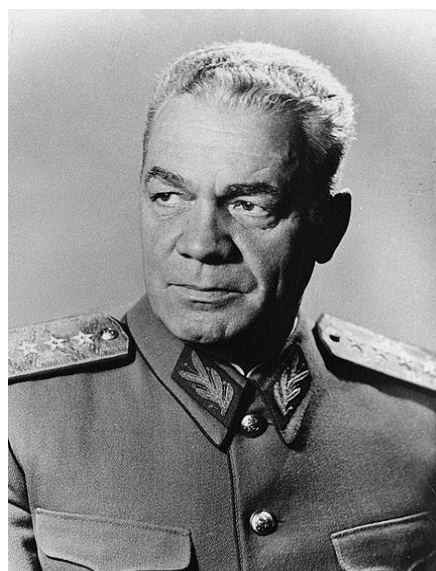
גנרל אמיל בודנראש

לעלות לישראל. על סמך חוות דעת זו הוחלט לחדש את ההרשמה לעלייה. בודנראש הוביל מדיניות שמגמתה הייתה הרחבת קשרי המסחר עם המערב והוצאת הכוחות הסובייטים מרומניה כיוון שהבין שמעמדה ורווחתה של רומניה לא תיושע מבריה"מ וארצות מזרח-אירופה בלבד. היה ברור לו שלא יוכל לחדש את העלייה לישראל במספרים גדולים כל עוד מצויים כוחות ניכרים של בריה"מ על אדמת רומניה, יחד עם זאת צריך להכין את הקרקע למהלך אשר פרוטיו צריכים להביא רווח מדיני וכלכלי.