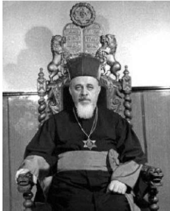
הרב משה רוזן

לאותם ילדים שהוריהם רצו שילמדו מעט את מקורות הדת היהודית. ואם קודם נדמה היה שאנשי ה"ועד" יצליחו לחסל כל דבר יהודי, האירה עתה ההצלחה את פניה לרב הראשי.