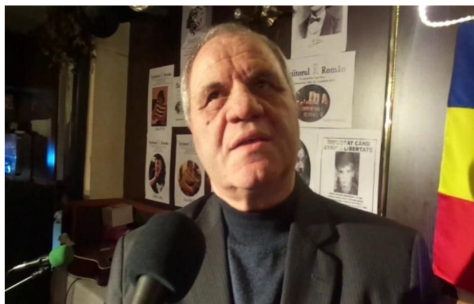
גנרל גיאורגה מרקו

בינתיים, בערוץ החשאי, באישור משייקה דן, ולאחר חידוש ההתעניינות של שירות המודיעין הרומני, שב יעקובר לתפקידו במגעים לחידוש העלייה לישראל. אולם מעתה, פעילותו של יעקובר הייתה תחת פיקוח צמוד של שייקה דן שמעמדו הפך דומיננטי בעיני הרומנים. צ'אושסקו ראה כעת בשייקה דן נציג (חשאי אמנם) של ממשלת ישראל ויחס חשיבות רבה למגעים ישירים באמצעותו. אולם הוא הנחה את שירותי המודיעין להקנות לעניין מאפיינים של הסכם אישי – "גנטלמני" בין שייקה דן למרקו (שהוחזר לתפקידו וקודם לדרגת גנרל) ולשמור זאת בחשאיות רבה.