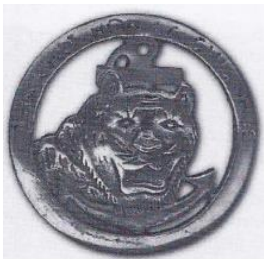
Insigne du Commando 24 avec pour devise "Tha Chet Hon La Chiu Nhuc" (plutôt la mort que la honte)

רוז'יה ונדנברג שזכה להערכה רבה על ניסיונו המבצעי ושיטות הלחימה שלו בהודו-סין עד אז, נבחר ע"י גנרל פרננד גמביה (Gambiez) 2 באישור דה-לטר דה-טאסיני לארגן ולפקד על אחת מהיחידות המאתגרות ביותר – "קומנדו 24". לצורך התפקיד החדש קיבל רוז'יה דרגת רב-נגד (Adjutant-Chef) ואישור מיוחד להיות מפקד יחידה על אף שלא היה קצין. ארגון היחידה, אשר בתקן מנתה 120 לוחמים, התבסס על יחידתו הקודמת "קומנדו 11" שכללה מתנדבים ויאטנמים מקומיים ולוחמי ויאט-מין שבויים אותם בחר רוז'יה באופן אישי במחנות השבויים וגייסם ליחידתו. היו אלו לוחמים שלרובם היה ניסיון קרבי קודם כולל לחימה בלילה. היה ברור לרוז'יה שגיוס כזה חושף אותו למעשי בגידה אבל מוכן היה לקחת את הסיכון, רוז'יה שיכנע אותם וחינך אותם מחדש. אימן את חייליו אימוני "קומנדו" מפרכים לפעילות בעומק שטח האויב תוך ניצול הידע שצבר בהלחמו במחתרת הצרפתית במלחמת העולם השנייה והניסיון שצבר בשלוש השנים מאז הגיעו להודו-סין.