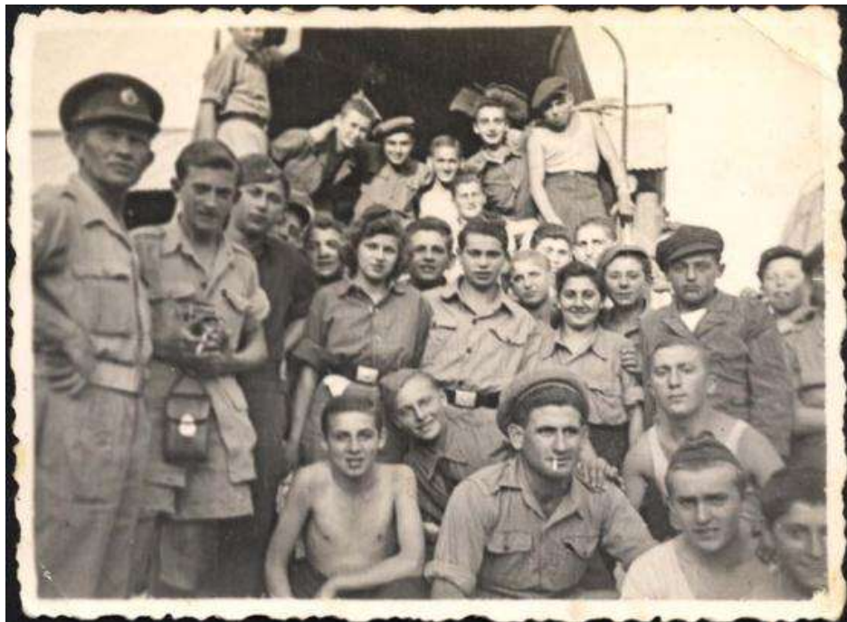
חיילי הבריגדה היהודית עם נערים ניצולי שואה, לאחר המלחמה [1]

כאשר גרמניה התקרבה בצעדי ענק על פני מרחבי צפון אפריקה, וכבר התקרבה אל גבול מצרים בדרך לארץ ישראל, היה היישוב היהודי שרוי בחשש אמיתי מפני הכיבוש שיביא לקץ העם היהודי בארצו. הוחלט אז להתבצר על הר הכרמל באופן דומה למתבצרי מצדה. בהגנה תכננו להקים מחלקת קומנדו שתפעל בעורף האויב, ותנסה לגרום לו לאבדות, שלפחות יעכבו את הגרמנים בדרכם. לצורך זה גייסו "ייקים" צעירים ואימנו אותם לתפקד כחיילים גרמנים לכל דבר. על המחלקה פיקד שמעון אבידן מעין השופט. [15]