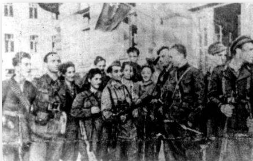
פרטיזנים מהפלוגה "נקמה". פולין ביער Rudniki.

לא הייתי החייל היחידי, שנלחם בכל מאודו בחיה הנאצית. משום שלנו היהודים היה גם חשבון משלנו בחשבון הכללי עם גרמניה הנאצית. [12]