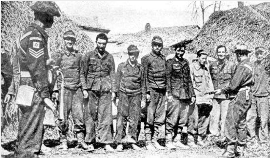
שבויים גרמניים בידי חיילי הבריגדה בחזית סניו איטליה [1]

למרות קנה המידה של הדברים שבהם עסקנו, ההרגשה שלי הייתה שקטונתי, לא עשינו כלום, באנו מאוחר מדי ועשינו מעט מדי, וההרגשה הזו, לצערי, מלווה אותי עד היום, וכאן אני רואה את עצמי כנציג הישוב של אז וההגנה של אז והבריגדה של אז. מעט מדי ומאוחר מדי.